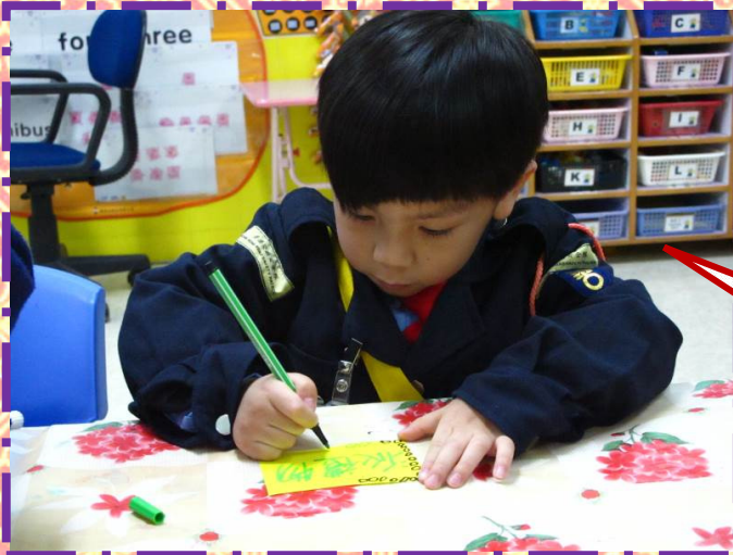
幼兒製作遊戲日海報用作 宣傳活動。