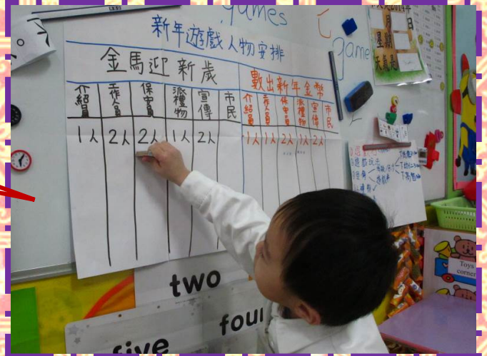
幼兒經老師協助製作工作 人員證。