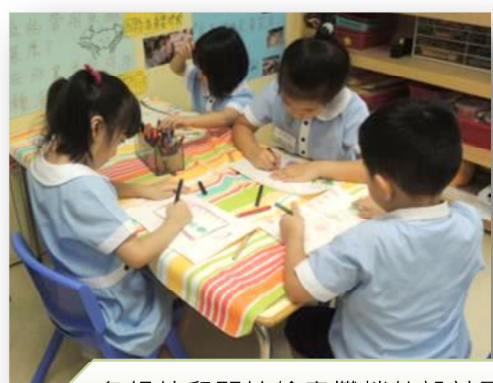
各組幼兒開始繪畫攤檔的設計圖。