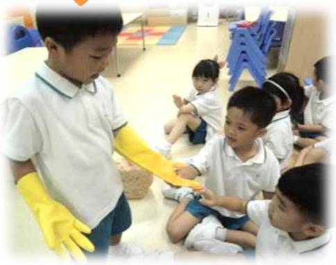
進行分工及搜集所需物料