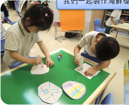
我們一起製作海鮮檔招牌