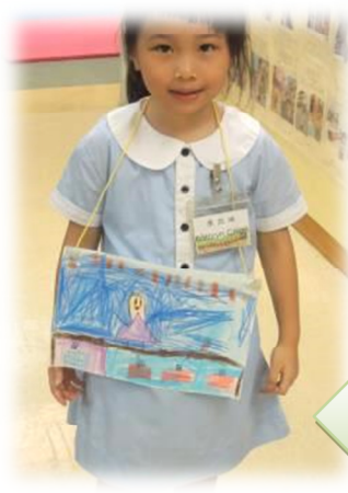
向幼兒介紹自己的設計圖，並討論攤檔的名字