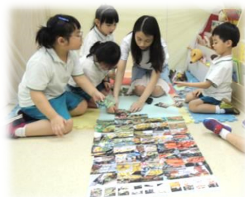
貼出自己所拍的照片